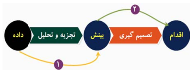
شکل ۳- مسیر تبدیل داده به اقدام درست

بنابر آن‌چه تا کنون گفته شد، برای درک و فهم عمیق از پدیده‌ها و مشاهدات باید مسیری طولانی از گردآوری داده‌ها تا رسیدن به اقدامی درست، بر مبنای تصمیم خردمندانه، پیموده شود. این مسیر در شکل ۳ به خوبی نشان داده است.