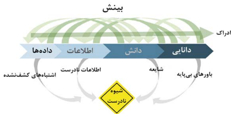
شکل ۲- فرایند دستیابی به بینش

فرهنگستان زبان و ادب پارسی بینش را اینگونه تعریف می‌کند: «درک عمیق از خود و روابط با دیگران که تجربه‌های پیشین را روشن یا فرد را در حل مسئله‌ای یاری می‌کند». در برخی متون بینش را بصیرت نیز نامیده‌اند که فرایندی است که به وسیله آن مسائل حل می‌شوند و مشخص‌کننده سازماندهی یا نوسازی است که به صورت عادت در فرد نهادیه شده و او را به فهم روابط مربوط به راه‌حل توانا می‌سازد. در بیان کلی اگر ادراک، شناختی به دست می‌دهد تا دانش و دانایی کسب شده از داده‌های ابتدایی طی فرایندی تجمیعی، به عمل و یا تصمیمی خردمندانه بیانجامد، بینش ایجاد و تقویت ظرفیت نهادینه شدن این فرایند و تبدیل آن به سبکی پیوسته و پایدار است. شکل ۲ این مفاهیم را در یک نما نشان می‌دهد.