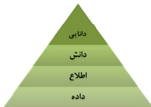
شکل ۱- هرم دانایی (DIKW)