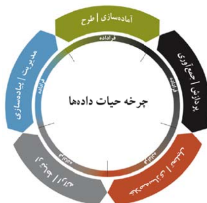
شکل ۴- نمودار چرخه حیات داده‌ها (هانترویتنی - ۲۰۱۲)

در پایان این بخش و پیش از پرداختن به انواع تحلیل و توضیح ویژگی‌ها و ابعاد آن‌ها، با ارایه تعریف نظری تحلیل داده‌ها تلاش می‌شود تا این مفهوم در ارتباط با داده‌ها و اطلاعات به خوبی تبیین شود.